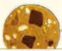
チョコ／穀シリアル

野の幸、山の幸、木の実、大地の恵。 一つの品に一つ以上の岩手の素材を用いる。 他にも国産をはじめ、選りすぐりの逸品素材を用い、香料や合成着色料に頼らず、素材が持つ特徴や風味の調和を大切に、「穀」シリーズクッキーです。