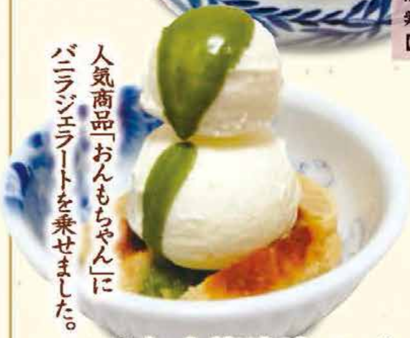
K14.スイートポテトジェラート 税込440円 (本体価格407円)