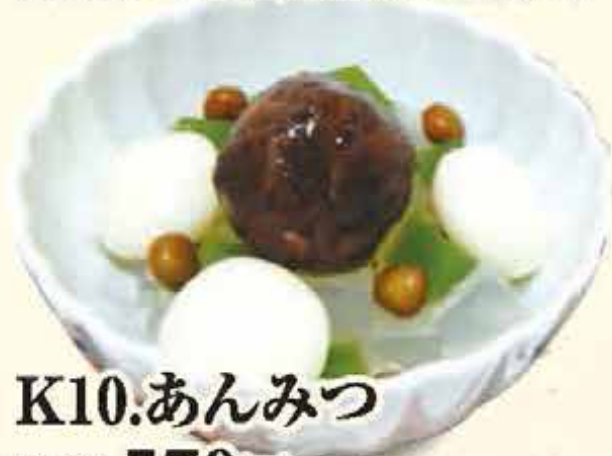
K10.あんみつ 税込570円 (本体価格528円)