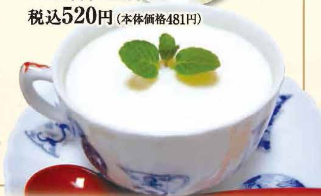
K15.杏仁豆腐 税込520円 (本体価格481円)

ジェラートをお選びください。 チョコ、いちご、ブルーベリー、カルーア、 黒豆、黒豆きなこ、小倉、ずんだ、 紫芋、抹茶、かぼちゃ、胡麻、バニラ 【季節限定】栗、桜もち