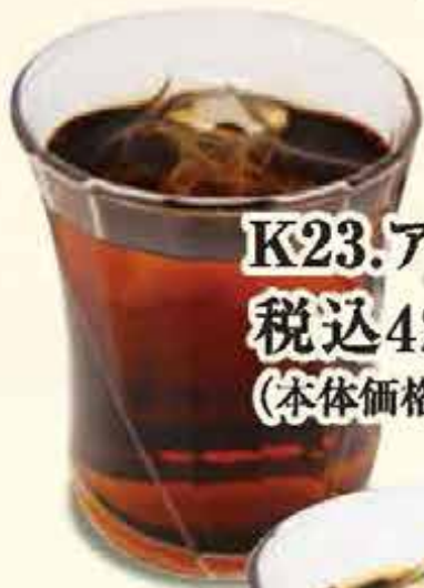
K23.アイスティー 税込420円 (本体価格389円)