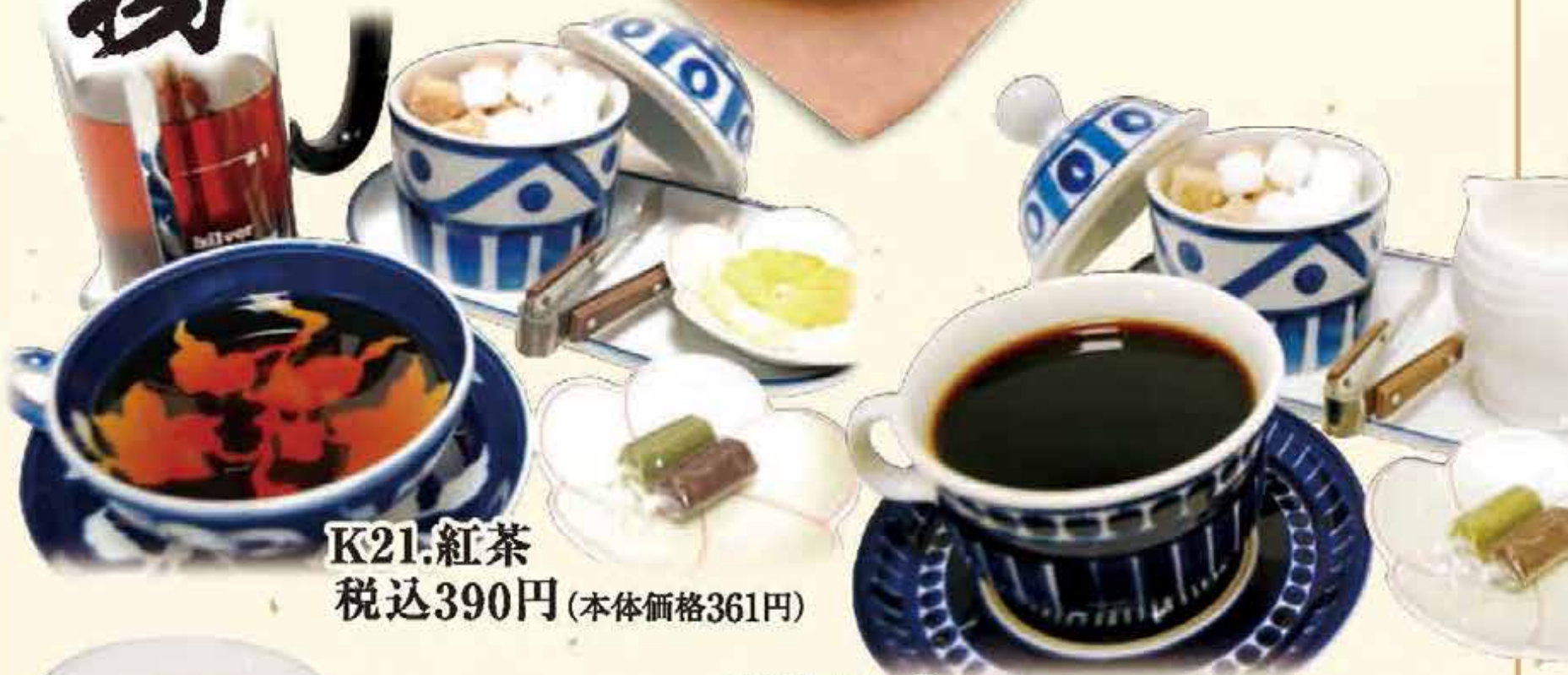
K21.紅茶 税込390円(本体価格361円)