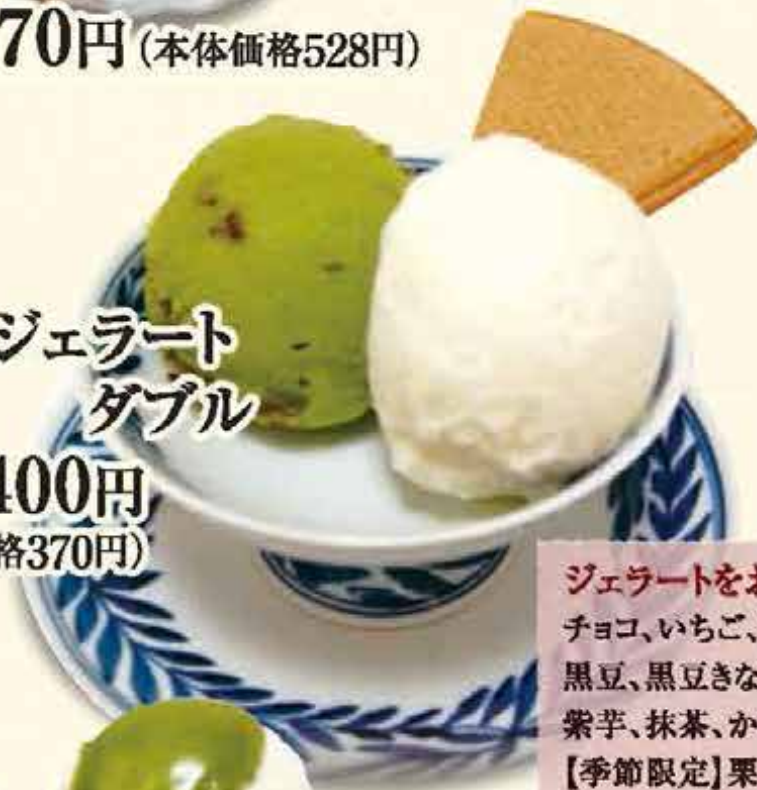
K12.ジェラート ダブル 税込400円 (本体価格370円)