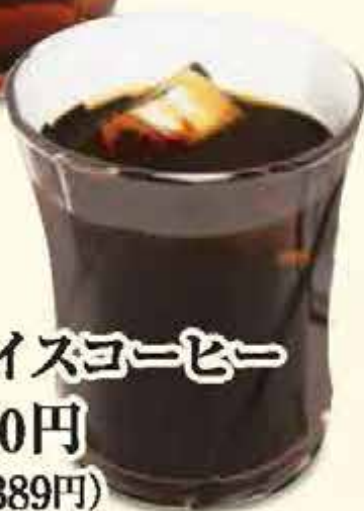
K24.アイスコーヒー 税込420円 (本体価格389円)