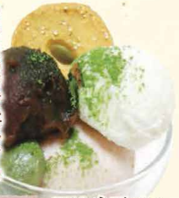
K13.白玉パフェ 税込500円 (本体価格463円)