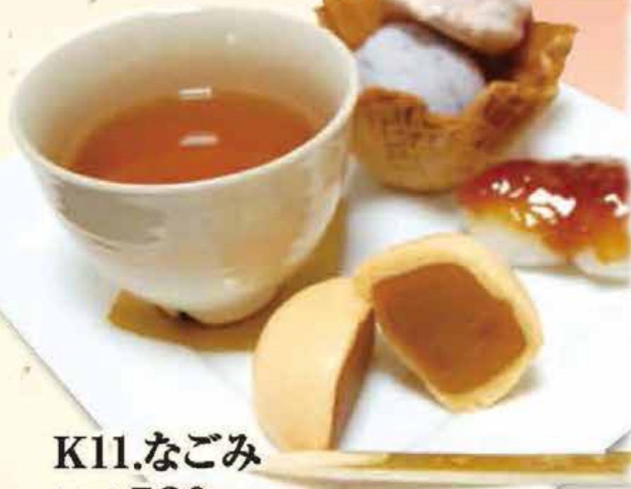
K11.なごみ 税込520円 (本体価格481円)