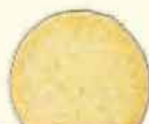
きび／ヘーゼルナッツ