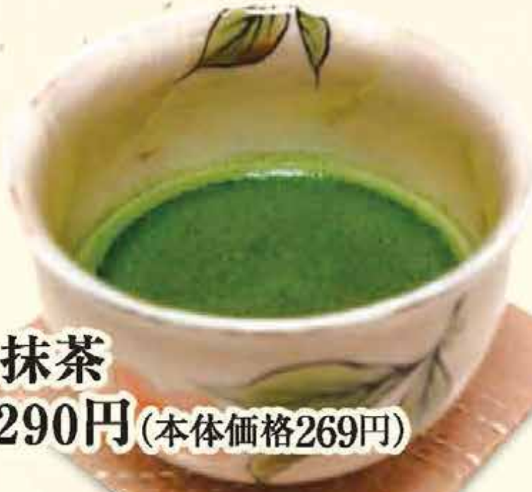
K20.抹茶 税込290円(本体価格269円)