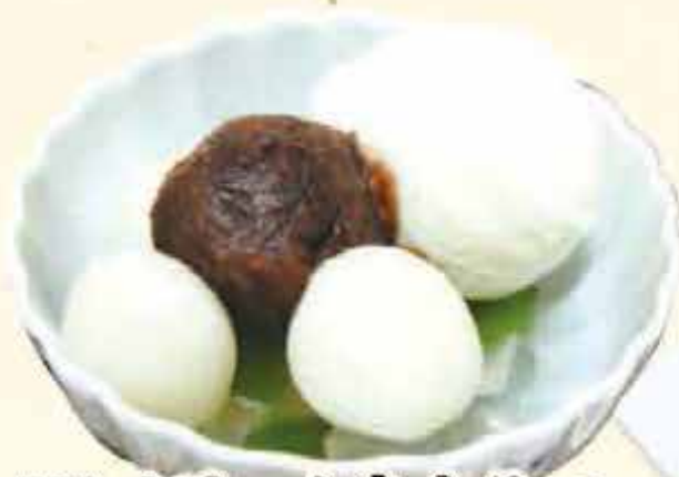
K9.クリームあんみつ 税込730円 (本体価格676円)